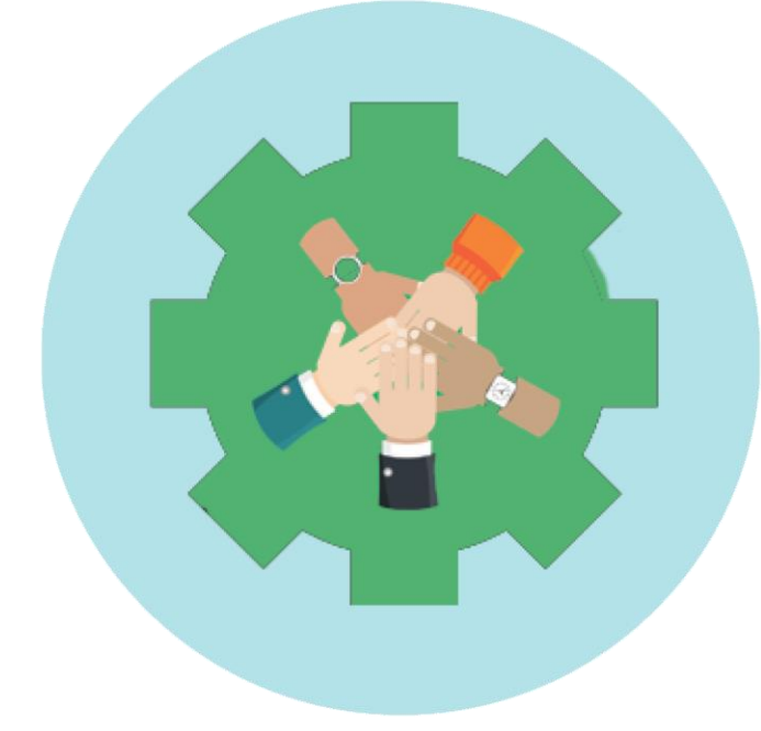
4 Gezamenlijke visie en werkwijze