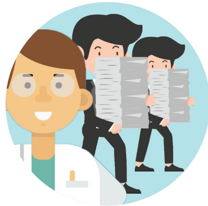
5 Optimaliseren taken en rol AVG