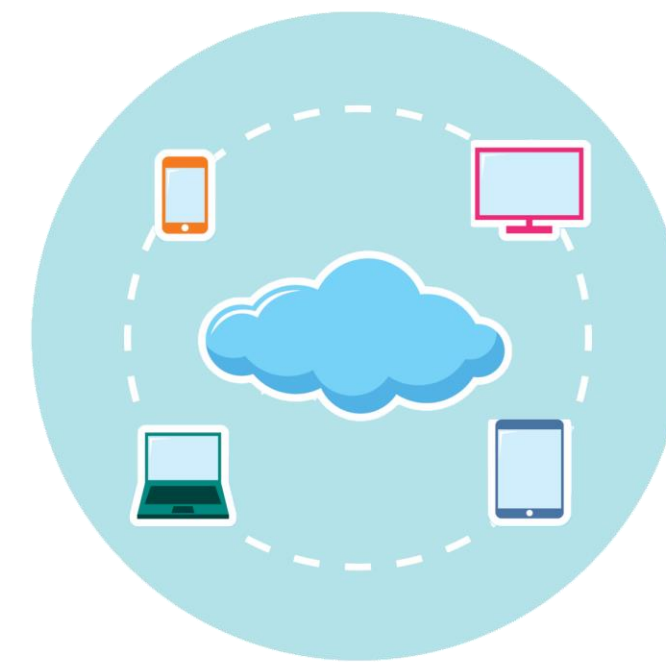
3 Regie op informatievoorziening