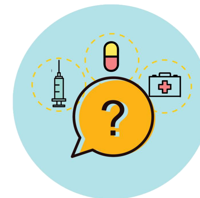
7 Routing tussen woning en medische zorg