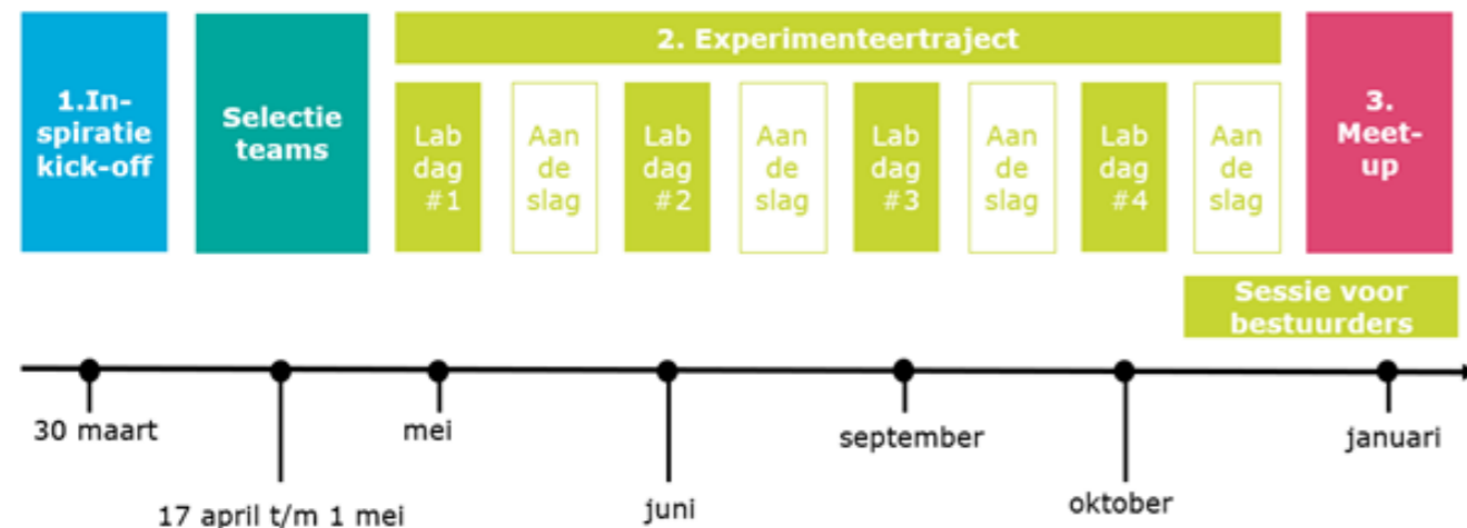
Figuur 2: Tijdslijn Lab 2030 #4 Weg met traditionele dagbesteding

De deelnemers aan Lab 2030 doorlopen de fases van design thinking in vier labdagen in de periode van mei tot en met december.