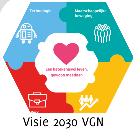
Visie 2030 VGN