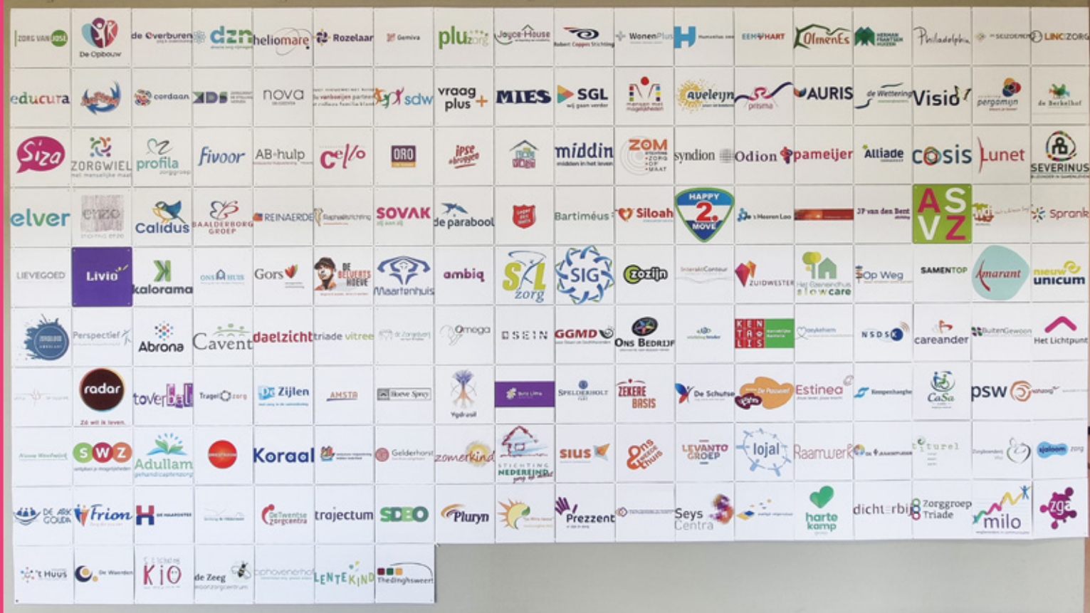
Foto: Naambordjes van de leden van de VGN aan de muur van het kantoor in Utrecht.