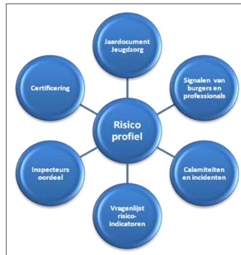
Figuur 2: risicomodel

De inspectie houdt risicogebaseerd toezicht . Dit houdt in dat zij toezicht uitvoert op die plaatsen waar volgens haar inschatting de risico's van onveiligheid en/of kwaliteitstekorten voor jongeren het grootst zijn. Die inschatting maakt de inspectie op basis van zowel interne als externe informatie, waarbij ook het professionele oordeel van de inspecteurs een belangrijke rol speelt.