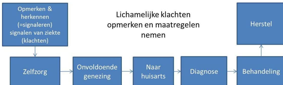
Figuur 1 Gebruikelijke route van signaleren lichamelijke klachten en maatregelen nemen

Dit bij jezelf opmerken en herkennen van lichamelijke klachten en vervolgens de juiste maatregelen nemen is voor mensen met een verstandelijke beperking meestal niet vanzelfsprekend. Voor het doorlopen van die route zijn ze in veel gevallen afhankelijk van anderen. Maar ook als mensen zelfstandig een arts bezoeken, is het belangrijk te weten waar je op moet letten om signalen van lichamelijke problemen te herkennen. Dat is ook belangrijk omdat mensen met een verstandelijke beperking in veel gevallen hun klachten niet altijd adequaat of tijdig uiten.